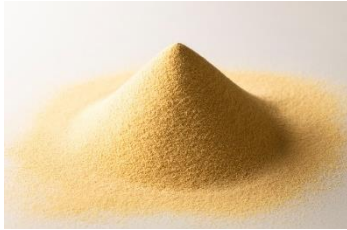
パラミロン高含有ユーグレナ EOD-1 株 原料

「パラミロン」は、微細藻類であるユーグレナのみが細胞内貯蔵物質として生成する高密度の不溶性食物繊維です。「パラミロン EOD-1」とは、ユーグレナの中でも（株）神鋼環境ソリューションが特許を取得している新規株「ユーグレナ EOD-1 株」に含まれるパラミロンのこと。近年の研究により、精神的・身体的疲労感の軽減効果が認められています。