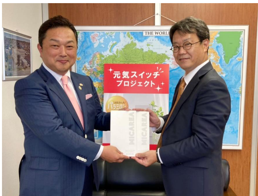
さくらCSホールディングスに「パラミロン EOD-1 製品」を寄贈

近年、介護サービスの社会的役割が伸長している一方で、介護従事者においては、身体的疲労はもちろんのこと精神的疲労の蓄積が大きな課題となっています。今回、厳しい就労環境のもとで業務を行っている介護従事者の精神的・身体的疲労を少しでも軽減するために、ミカレアより心と体の疲労軽減効果が認められているパラミロン EOD-1 製品をさくらCSホールディングスに寄贈し、所属の介護スタッフ170名に飲んで頂くことで、健康を保持して質の高い介護サービスの提供を継続していくことを目的としています。