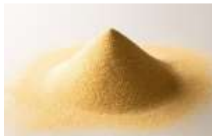
パラミロン高含有ユーグレナ EOD-1 株原料

「パラミロン」は、微細藻類であるユーグレナのみが細胞内貯蔵物質として生成する高密度の不溶性食物繊維です。「パラミロン EOD-1」とは、ユーグレナの中でも（株）神鋼環境ソリューションが特許を取得している新規株「ユーグレナ EOD-1 株（金色のユーグレナ）」に含まれるパラミロンのこと。近年の研究により、自律神経のバランスを整え、精神的・身体的疲労感を軽減する効果が認められ、特許を取得しています。