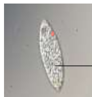
パラミロン高含有のユーグレナ (EOD-1 株)