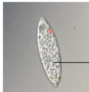
パラミロン高含有のユーグレナ (EOD-1 株)