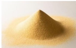
パラミロン高含有ユーグレナ EOD-1 株原料

「パラミロン」は、微細藻類であるユーグレナのみが細胞内貯蔵物質として生成する高密度の不溶性食物繊維です。「パラミロン EOD-1」とは、ユーグレナの中でも（株）神鋼環境ソリューションが特許を取得している新規株「ユーグレナ EOD-1 株（金色のユーグレナ）」に含まれるパラミロンのこと。近年の研究により、自律神経のバランスを整え、精神的・身体的疲労感を軽減する効果が認められ、特許を取得しています。