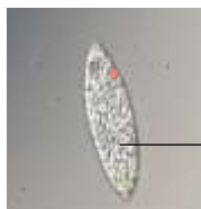
パラミロン高含有のユーグレナ (EOD-1 株)