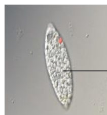
パラミロン高含有の ユーグレナ (EOD-1 株)