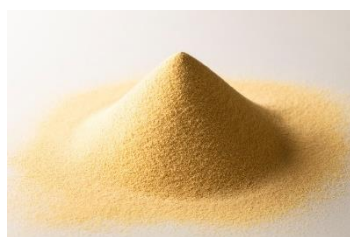
パラミロン高含有ユーグレナガラス EOD-1 株 原料

※試験期間：2017年8月～2018年1月／出典：第40回日本臨床栄養学会総会・第39回日本臨床栄養協会総会 第16回大連合大会